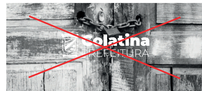
LOGO BRANCA FUNDO FOTOGRÁFICO P&B